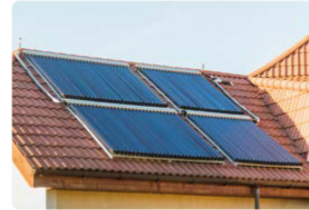
« Tafoukt » est un projet de réalisation de plusieurs centrales solaires photovoltaïques d'une capacité cumulée de 4 000 MW

Quatre (04) communes pilotes ont été retenues pour contribuer à la réalisation des objectifs tracés dans le cadre du plan national de transition énergétique, par ailleurs, la consommation de l'énergie de trente (30) autres communes-pilotes sera étudiée et suivie à travers des tableaux de bord élaborés à ce effet. Le projet va durer jusqu'en 2023