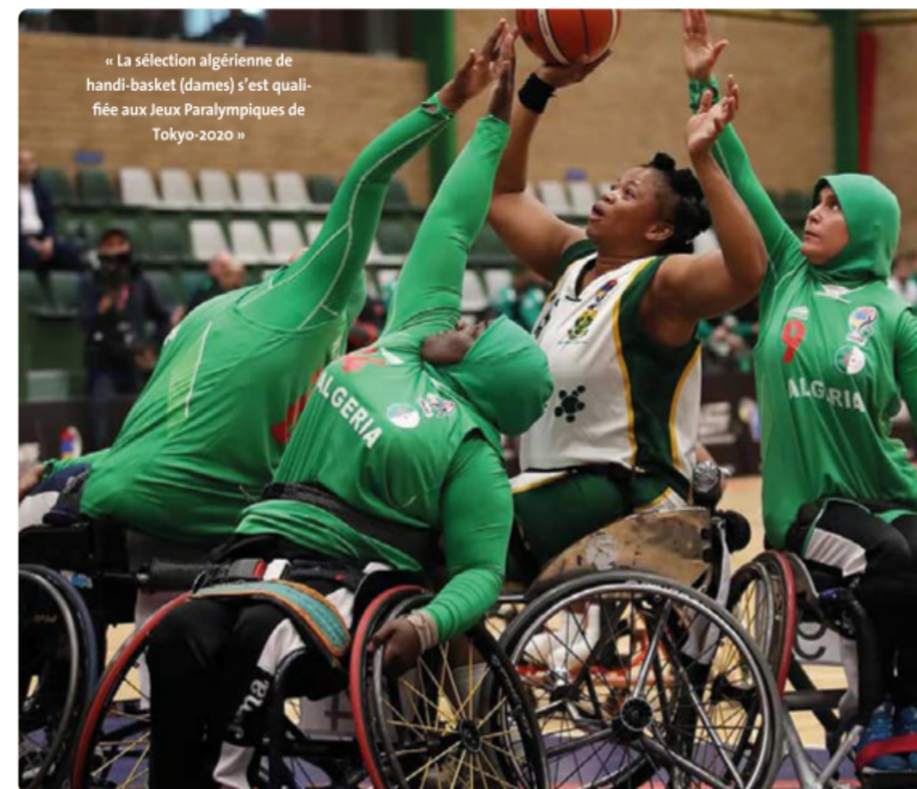
« La sélection algérienne de handi-basket (dames) s'est qualifiée aux Jeux Paralympiques de Tokyo-2020 »

Pour cette année la particularité a été l'intérêt porté par la faculté de Leipzig au Handisport en créant un créneau ciblant les managers de cette catégorie pour encourager l'intégration des personnes handicapées à la pratique de l'activité physique et du sport, une initiative très appréciée et bien accueillie par les participants et le grand public.