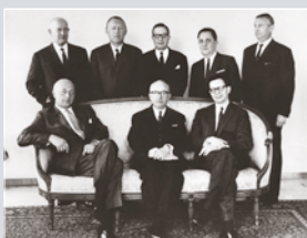
Die Kommission der neugegründeten EWG. In der Mitte WALTER HALLSTEIN (1901-1982), Präsident der Europäischen Kommission 1958-1967