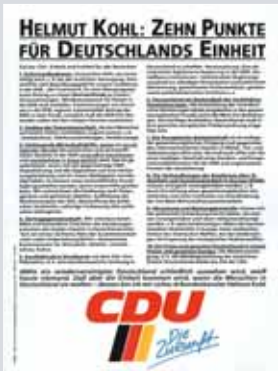
HELMUT KOHLS Zehn-Punkte-Plan für die Einheit Deutschlands

Dem Grundgesetzauftrag verpflichtet, hält die CDU am Ziel der deutschen Einheit auch in der Zeit anhaltender Ost-West-Spannungen unverrückbar fest. Ihre aktive Europa- und Bündnispolitik schafft die Voraussetzung für eine positive Entwicklung der innerdeutschen Beziehungen. So wird in einer veränderten weltpolitischen Lage die Wiedervereinigung 1990 möglich. Helmut Kohl stellt in entscheidender Stunde die Weichen.