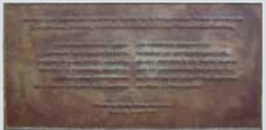
KONRAD ADENAUER und CHARLES DE GAULLE über die deutsch-französische Freundschaft (Gedenktafel vor der Akademie der Konrad-Adenauer-Stiftung in Berlin)