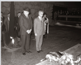
Bundeskanzler HELMUT KOHL bei seinem Staatsbesuch 1984 in der Gedenkstätte Yad Vashem