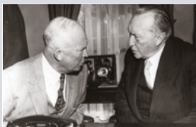
Bundeskanzler KONRAD ADENAUER im Gespräch mit US-Präsident DWIGHT D. EISENHOWER im Weißen Haus am 28. Oktober 1954