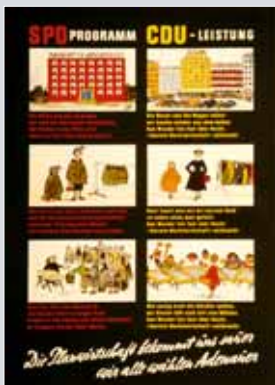
Plakat zur Bundestagswahl 1953