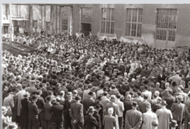
CDU-Versammlung am 12. Mai 1946 in Düsseldorf mit KONRAD ADENAUER