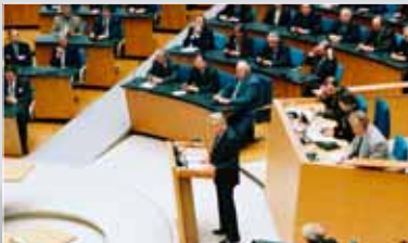
Erstmals spricht im Januar 1996 ein israelischer Staatspräsident, EZER WEIZMANN , im Deutschen Bundestag.