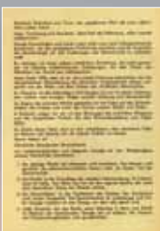
Auszug aus den Kölner Leitlinien