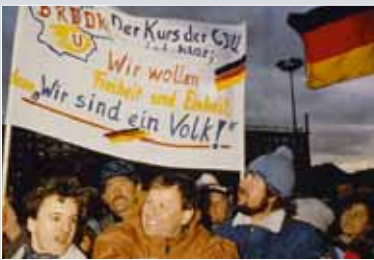
19. Dezember 1989: Bundeskanzler HELMUT KOHL wird von jubelnden Menschen auf dem Dresdener Flughafen erwartet.