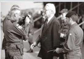
Verteidigungsminister GERHARD STOLTENBERG bei Indienststellung der deutsch-französischen Brigade 1990 in Böblingen