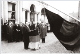
Ministerpräsident HUBERT NEY bei der Hissung der Flagge des Saarlandes und der Bundesrepublik 1957