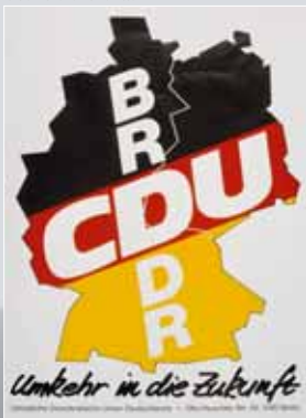
Volkskammerwahl am 18. März 1990

Dem Grundgesetzauftrag verpflichtet, hält die CDU am Ziel der deutschen Einheit auch in der Zeit anhaltender Ost-West-Spannungen unverrückbar fest. Ihre aktive Europa- und Bündnispolitik schafft die Voraussetzung für eine positive Entwicklung der innerdeutschen Beziehungen. So wird in einer veränderten weltpolitischen Lage die Wiedervereinigung 1990 möglich. Helmut Kohl stellt in entscheidender Stunde die Weichen.