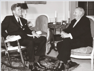
Vizekanzler LUDWIG ERHARD trifft JOHN F. KENNEDY im Januar 1962 im Weißen Haus