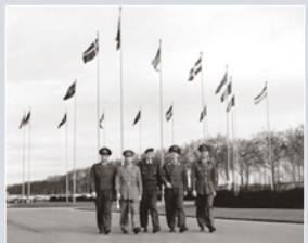
Deutsche und Alliierte Soldaten vor der NATO in Paris, 1957