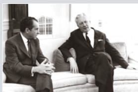
Bundeskanzler KURT GEORG KIESINGER im Gespräch mit Präsident RICHARD NIXON am 7. August 1969 in Washington