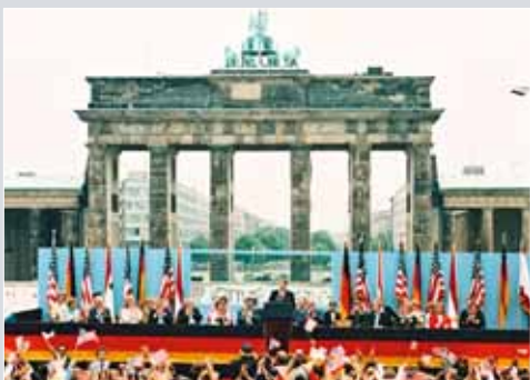
Bundeskanzler HELMUT KOHL und Präsident RONALD REAGAN am 12. Juni 1987 vor dem Brandenburger Tor in Berlin