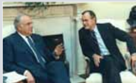
Bundeskanzler HELMUT KOHL im Gespräch mit Präsident GEORGE BUSH am 17. Mai 1990 in Washington