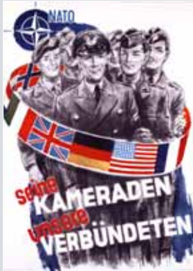
Werbeplakat für die in die NATO integrierte Bundeswehr, um 1956

Die CDU hat die Politik der Doppelstrategie entschieden vertreten. „Frieden schaffen mit immer weniger Waffen“ war eine der Leitlinien deutscher Politik in der Kanzlerschaft von HELMUT KOHL.