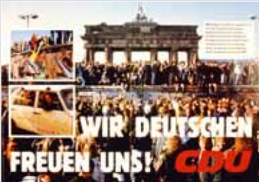
Wandzeitung nach dem Fall der Mauer am 9. November 1989