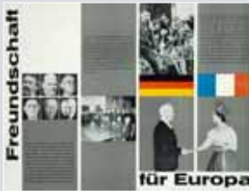
Wandzeitung „Freundschaft für Europa“ zur Arbeit des deutsch-französischen Jugendwerkes von 1965