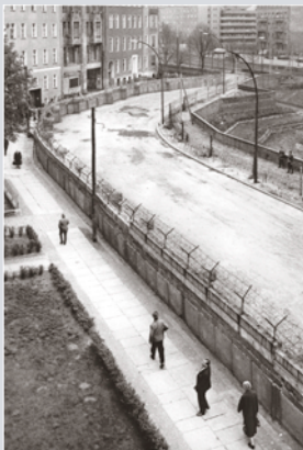
Am 13. August 1961 beginnen ULBRICHT und CHRUSCHTSCHOW mit dem Bau der Mauer in Berlin – sie wird zum Symbol der deutschen Teilung. Zehntausende versuchen, das 168 km lange Bollwerk zu überwinden, Hunderte lassen dabei ihr Leben.

Ein Sonderparteitag der CDU in der DDR am 15./16. Dezember 1989 in Berlin bringt die Abkehr vom Sozialismus und das Bekenntnis zu Sozialer Marktwirtschaft und parlamentarischer Demokratie. Die Partei präsentiert sich personell, organisatorisch und programmatisch weitgehend erneuert. Neuer Vorsitzender wird LOTHAR DE MAIZIERE. Für die Volkskammerwahl 1990 schließen sich die neugegründeten Parteien Demokratischer Aufbruch (DA) und Deutsche Soziale Union (DSU) mit der CDU zur „Allianz für Deutschland“ zusammen. Aus den Wahlen geht die CDU mit 40,9% der Stimmen als stärkste Partei hervor („Allianz für Deutschland“ 48,15%), DE MAIZIERE wird Ministerpräsident. Hauptziel seiner Regierung ist die möglichst rasche Herstellung der deutschen Einheit nach Art. 23 des Grundgesetzes.