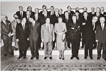
Die Staats- und Regierungschefs und die Außenminister der EG-Staaten beraten im Dezember 1991 in Maastricht über den Vertrag zur Gründung der EU.

Regierungserklärung von Bundeskanzler HELMUT KOHL am 4. Mai 1984