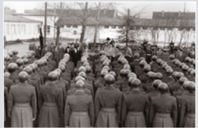
KONRAD ADENAUER vor den neuen Streitkräften in Andernach am 20. Januar 1956