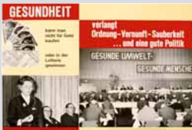
Wandzeitung 1. Gesundheitspolitischer Kongreß der CDU in Oberhausen 1964

Auch das Ziel einer ökologischen Sanierung der neuen Bundesländer nach der Wiedervereinigung wird zielstrebig und erfolgreich angepackt und umgesetzt.