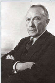
KONRAD ADENAUER (1876-1967), Zentrum, 1917-1933 Oberbürgermeister von Köln, 1946-1955 Vorsitzender der CDU Rheinland und 1946-1949 der CDU der britischen Zone, 1949-1963 Bundeskanzler