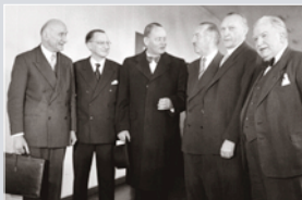
Die Regierungschefs bzw. Außenminister der EGKS-Staaten 1951, v.l.: ROBERT SCHUMAN (F), ALCIDE DE GASPERI (I), DIRK UDO STIKKER (NL), PAUL VAN ZEELAND (B), KONRAD ADENAUER (D), JOSEPH BECH (Lux)