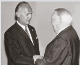
Bundeskanzler LUDWIG ERHARD begrüßt ASHER BEN-NATAN , den ersten israelischen Botschafter in Bonn, 1965