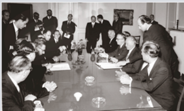
Bundeskanzler KONRAD ADENAUER und Außenminister MOSHE SHARETT unterzeichnen am 10. September 1952 in Luxemburg das Wiedergutmachungsabkommen.

Nach der Aufnahme diplomatischer Beziehungen im Mai 1965 kam es zu vielfältigen Kontakten durch Staatsbesuche, Schüleraustausch, Städtepartnerschaften, Reisen ins Heilige Land, wissenschaftliche und wirtschaftliche Kooperation.