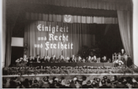
Erster Parteitag der Christlich-Demokratischen Union Deutschlands in Goslar vom 20. bis 22. Oktober 1950