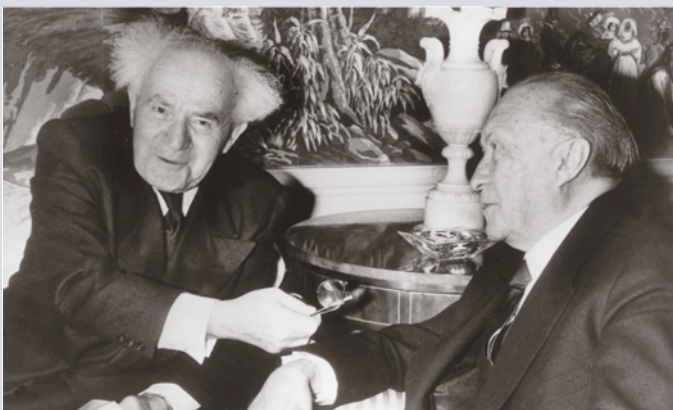
Erstes Treffen des israelischen Ministerpräsidenten DAVID BEN GURION mit Bundeskanzler KONRAD ADENAUER in New York, 14. März 1960