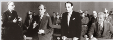
v.l.: ANDREAS HERMES (1878 - 1964), Zentrum, 1920-1923 Reichsminister, Kontakte zur Widerstandsbewegung um Carl Goerdeler, im Januar 1945 zum Tode verurteilt EUGEN GERSTENMAIER (1906 - 1986), wegen Beteiligung am Attentat auf Hitler im Januar 1945 zu sieben Jahren Zuchthaus verurteilt, 1954-1969 Präsident des Deutschen Bundestags OTTO LENZ (1903-1957), Kontakte zum Goerdeler-Kreis, im Januar 1945 zu vier Jahren Zuchthaus verurteilt, 1951-1953 Staatssekretär im Bundeskanzleramt THEODOR STELTZER (1885 - 1967), Kontakte zum Kreisauer Kreis, im Januar 1945 zum Tode verurteilt

Die selbständigen Landesparteien arbeiteten überzonal zusammen in der „Arbeitsgemeinschaft der CDU/CSU “, im Wirtschaftsrat und im Parlamentarischen Rat. Erst im Oktober 1950 einigten sie sich auf dem ersten Parteitag der CDU in Goslar über den Zusammenschluß und wählten Bundeskanzler KONRAD ADENAUER zum Ersten Vorsitzenden.