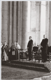
KONRAD ADENAUER und CHARLES DE GAULLE 1962 in der Kathedrale von Reims