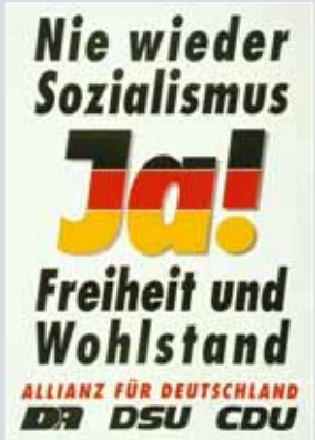
Plakat der „Allianz für Deutschland“ für die Volkskammerwahl am 18. März 1990