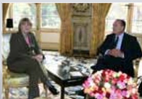
Besuch von ANGELA MERKEL beim französischen Staatspräsidenten JACQUES CHIRAC 2003 in Paris