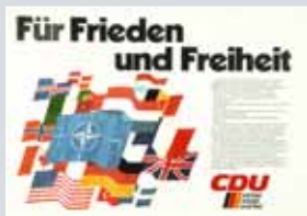
Wandzeitung: Für Frieden und Freiheit