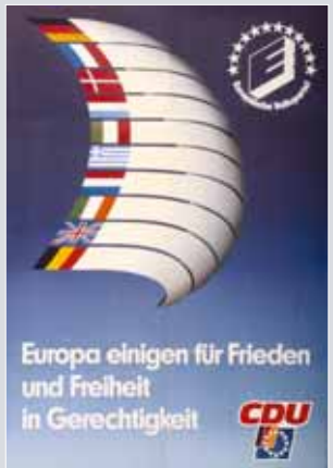
Plakat der CDU und der Europäischen Volkspartei (EVP) zur zweiten Direktwahl des Europäischen Parlaments 1984