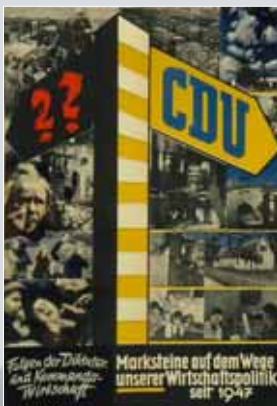
Plakat zur Bundestagswahl 1949

Ende der 50er Jahre ist die Vollbeschäftigung erreicht.