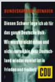
Wahlplakat: Bundeskanzler KONRAD ADENAUER anlässlich der Wahlen zum 2. Deutschen Bundestag am 6. September 1953. Im Hintergrund steht die Erfahrung des Volksaufstandes in der DDR vom 17. Juni 1953.

Die Geschichte der CDU in der SBZ/DDR ist bestimmt durch den Zwang zur Anpassung an die Politik der sowjetischen Besatzungsmacht und der SED. Widerständige Führungspersönlichkeiten werden bedroht, abgesetzt, verhaftet, verurteilt oder zur Flucht gezwungen. In der Folge ist die CDU in der DDR geprägt von SED-genehmen Funktionären; sie machen die Partei innerhalb weniger Jahre zu einem Hilfsorgan der SED. Es gelingt ihnen jedoch nicht, die gesamte Mitgliedschaft auf die SED-Linie einzuschwören. An der Basis der Partei zeigen sich immer wieder Unmut und kritische Distanz. Mit den Reformbewegungen in den Ostblockländern steigt auch in der CDU die Unzufriedenheit der Mitglieder mit der Parteiführung. Im „Brief aus Weimar“, den vier CDU-Mitglieder – allesamt Kirchenleute – am 10. September 1989 an die Parteileitung schicken, werden wesentliche Kritikpunkte der vergangenen Jahrzehnte aufgegriffen. Es zeigt sich, dass an der Basis christlich-demokratische Ideale lebendig geblieben sind.