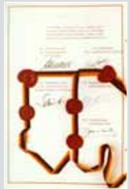
Auszug aus der Präambel des deutsch-französischen Vertrages von 1963