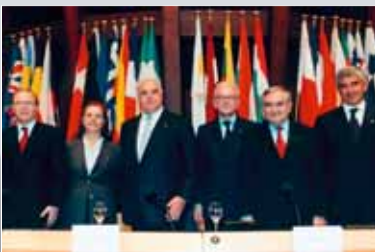
Gedenkfeier mit HELMUT KOHL zum 50. Jahrestag der Gründung der EVP-Fraktion in Straßburg am 1. Juli 2003, v.l.: WILFRIED MARTENS (8. Präsident der EVP), LOYOLA DE PALACIO (E. Vizepräsidentin der Europäischen Kommission), HELMUT KOHL, HANS-GERT PÖTTERING (Ü, Vorsitzender der EVP-ED-Fraktion), JEAN-PIERRE RAFFARIN (F, Premierminister) und PIER FERDINANDO CASINI (I, Präsident der Deputiertenkammer)