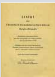
Auszug aus dem Statut der CDU, 1950