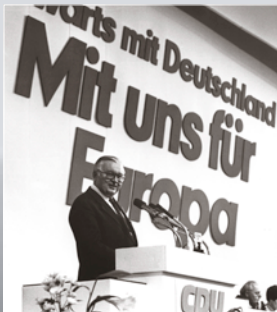
EGON ALFRED KLEPSCH, 1977-1982 und 1984-1992 Vorsitzender der EVP-Fraktion, 1992-1994 Präsident des Europäischen Parlaments