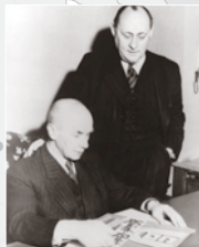
JAKOB KAISER (1888-1961), Zentrum, Landesgeschäftsführer der Christlichen Gewerkschaften in Westdeutschland, bildet mit anderen Gewerkschaftsführern einen Widerstandskreis, 1938 verhaftet, nach dem 20. Juli mit Haftbefehl gesucht, untergetaucht, 1945-1947 Vorsitzender der CDU in der SBZ, 1949-1957 Bundesminister für gesamtdeutsche Fragen