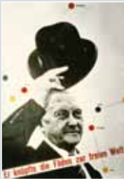
KONRAD ADENAUER: Er knüpfte die Fäden zur freien Welt, 1953

Der Eintritt der Bundesrepublik Deutschland in die NATO und die Gründung der Bundeswehr sind entscheidende Schritte auf dem Weg der Wiedereingliederung Deutschlands in die Gemeinschaft freier Völker.