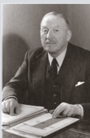
ANDREAS HERMES (1878 - 1964), Zentrum, 1945 Erster Vorsitzender der CDU in der SBZ, Präsident des deutschen Bauernverbands (1947 - 1954) und des Raiffeisenverbands (1948 - 1961).