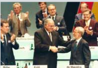
Beim 38. CDU-Bundesparteitag am 1. Oktober 1990 in Hamburg deklarieren sich die neu errichteten Landesverbände der CDU in der DDR als „Teil der Christlich-Demokratischen Union Deutschlands“. So kann dieser Parteitag übergehen in den gesamtdeutschen 1. Parteitag der CDU Deutschlands (1./2. Oktober 1990).