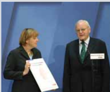
Übergabe des Abschlußberichts der Herzog-Kommission durch ROMAN HERZOG an ANGELA MERKEL September 2003

Heute soll eine neue Soziale Marktwirtschaft die Voraussetzung dafür schaffen, daß die Prinzipien der Freiheit, Gerechtigkeit und Solidarität auch in Zukunft gelebt werden können mit dem Ziel der Wir-Gesellschaft.