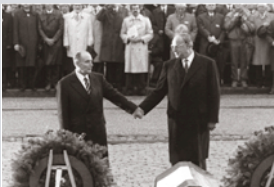
HELMUT KOHL und FRANÇOIS MITTERRAND 1984 in Verdun