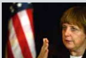
ANGELA MERKEL während ihres USA-Besuches 2003