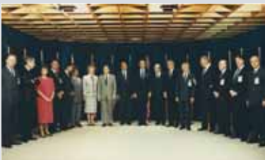
NATO-Gipfeltreffen am 23. Mai 1989 in Brüssel mit NATO-Generalsekretär MANFRED WÖRNER und Bundeskanzler HELMUT KOHL