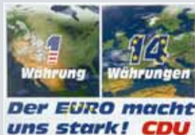
Plakat der CDU zur Europawahl 1999