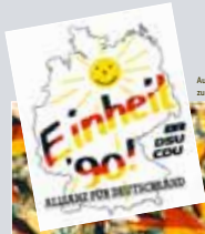
Aufkleber der „Allianz für Deutschland“ zur Volkskammerwahl vom 18. März 1990