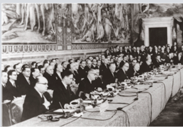
Die Unterzeichnung der Römischen Verträge 1957