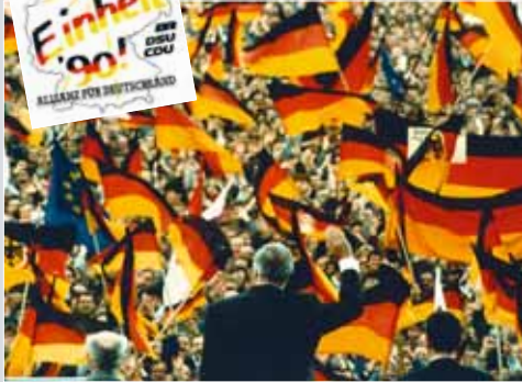
Bundeskanzler HELMUT KOHL als CDU-Parteivorsitzender bei einer Wahlkampfveranstaltung in Erfurt am 20. Februar 1990