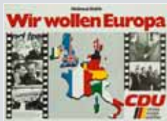
Plakat der CDU zur ersten Direktwahl des Europäischen Parlaments 1979