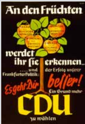
Plakat zur Kommunalwahl in NRW 1948

Vordringliche Aufgabe nach dem Ende des 2. Weltkrieges ist die Heilung der Kriegsschäden und Kriegsfolgen: Die Bewältigung der großen Nöte, die Versorgung der Bevölkerung, die Hebung der Produktion und die Schaffung von Arbeitsplätzen werden mit innovativen Mitteln in Angriff genommen. Millionen von Kriegsheimkehrern, Vertriebenen und Flüchtlingen müssen integriert werden.